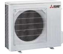
MUZ-AY 50 VG