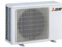
MUZ-AY 25/35/42 VG